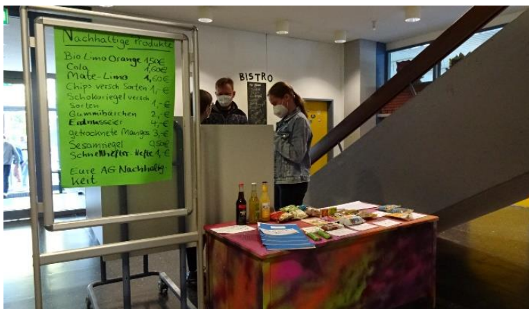
Der Verkaufsstand der AG Nachhaltigkeit