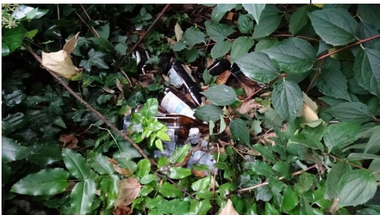
Illegale Müllhalde im Gebüsch: 17 Glasflaschen mit Pfand

Und dann gibt es noch eine sehr ärgerliche Sache: Illegale Müllhalden - eine solche wurde auch von der Nachhaltigkeits-AG entdeckt. In einem Gebüsch fanden Herr Molinski und ein AG Mitglied viele Flaschen, von denen die meisten auch Pfandflaschen waren. Besonders merkwürdig: Direkt vor besagtem Busch steht ein Mülleimer, in den man die Flaschen hätte entsorgen können.